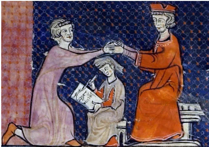
Document 1 • Cérémonie d'hommage

Le comte demanda au futur vassal s'il voulait devenir son homme sans réserve. Celui-ci répondit: « Je le veux. » Ses mains étant jointes dans celles du comte, ils s'allièrent par un baiser. Puis le vassal dit: « Je promets en ma foi d'être fidèle à partir de cet instant au comte Guillaume et de lui garder contre tous et entièrement mon hommage, de bonne foi et sans tromperie. »