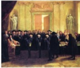
Document 3 - Le roi avec son Conseil des ministres (Louis XIV tenant la scène, 1672)