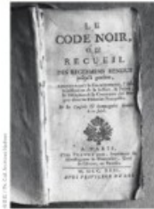
Le roi Louis XIV publie un texte réglementant la vie dans les plantations esclavagistes dans les colonies (1685).