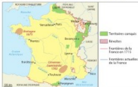
Liste des guerres de Louis XIV (1661-1715)

Guerre de dévolution (1667-1668) Guerre de Hollande (1672-1678) Guerre des réunions (1683-1684) Guerre de la ligue d'Augsbourg (1688-1697) Guerre de Succession d'Espagne (1701-1714)