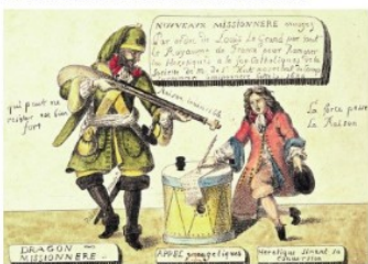
Une représentation des dragonnades.