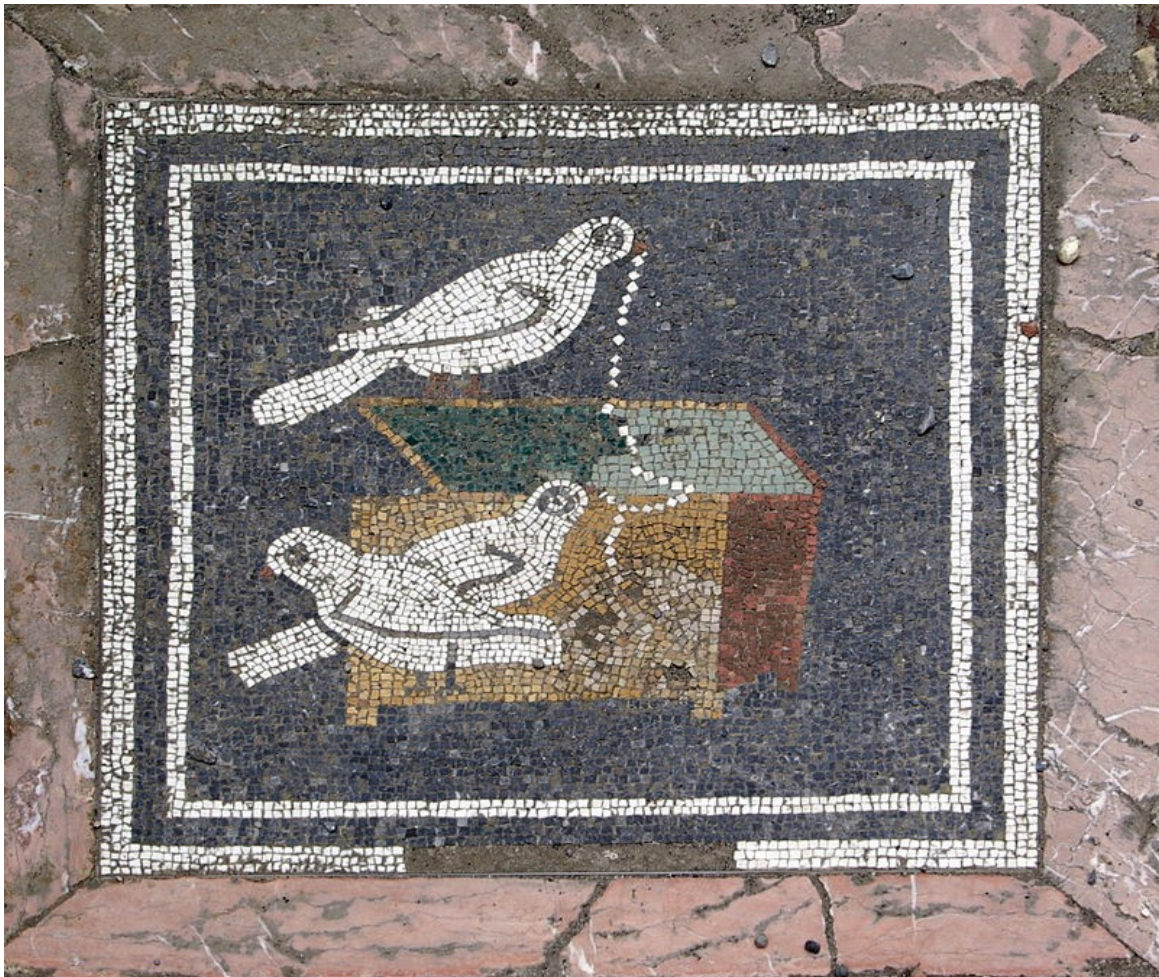
Colombes, mosaïque de Pompéi.