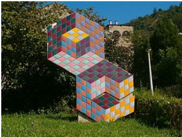
Œuvre de Vasarely devant l'église des Paulins à Pécs.

Elle est encore utilisée de nos jours notamment pour la décoration des églises. Ainsi en France, à Paris, le plafond de l'abside de la basilique du Sacré-Cœur de Montmartre est décoré de la plus grande mosaïque de France, couvrant une surface de 475 m 2 , conçue par Luc-Olivier Merson et exécutée de 1900 à 1922 par les ateliers Guilbert-Martin.