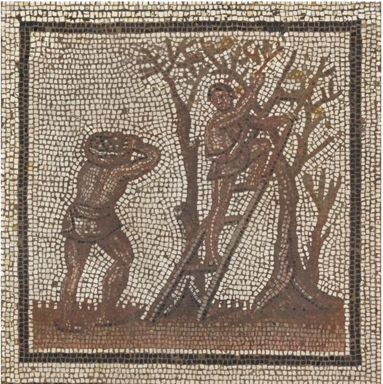
La cueillette des olives, mosaïque de St Romain en Gal, début du 3 e siècle ap JC