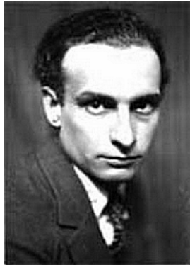
Philippe SOUPAULT (1897-1990)

Laissez chanter L'eau qui chante Laissez courir L'eau qui court Laissez vivre L'eau qui vit L'eau qui bondit L'eau qui jaillit Laissez dormir L'eau qui dort Laissez mourir L'eau qui meurt.