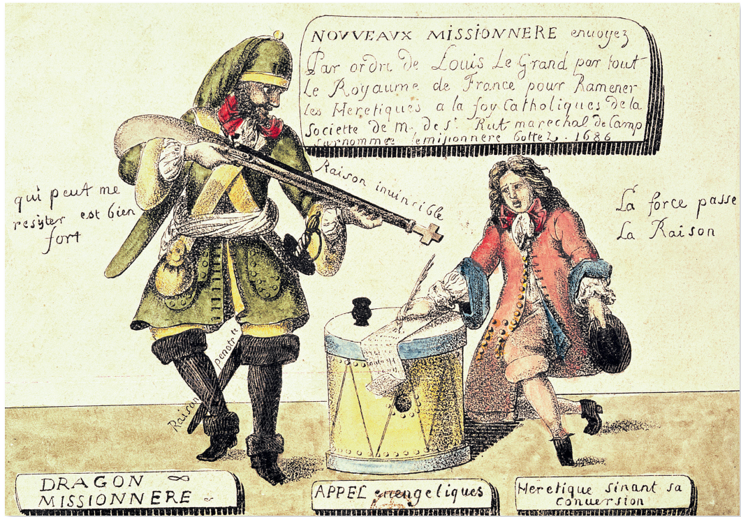
Une représentation des « dragonnades ».