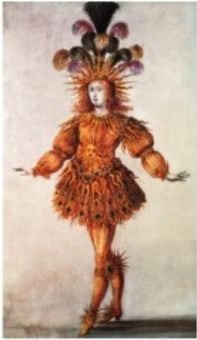
Document 1 • Louis XIV déguisé en soleil, dans le « Ballet royal de la nuit »