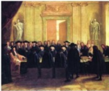
Document 3 • Le roi avec son Conseil des ministres (Louis XIV tenant le sceau, 1672)