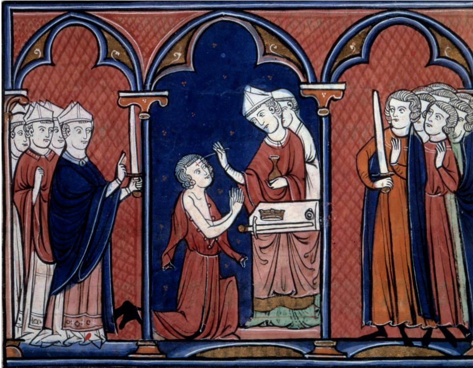
Le sacre de Louis IX dans la cathédrale de Reims, 29 novembre 1226 (il a 12 ans).