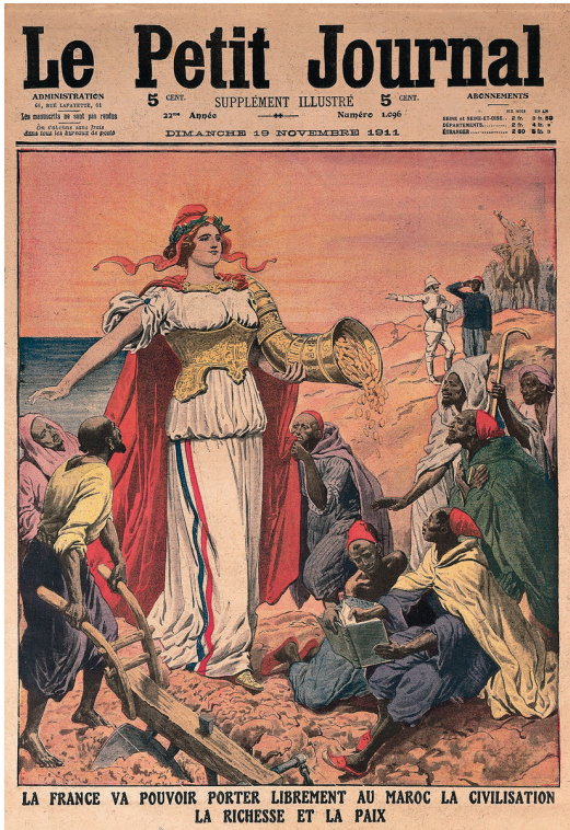
Les bienfaits de la colonisation française au Maroc Supplément illustré du Petit journal , novembre 1911

1 Observe ce document et réponds aux questions.