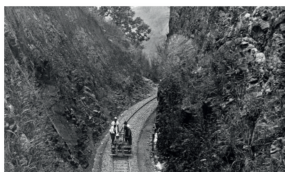
Le développement du pays