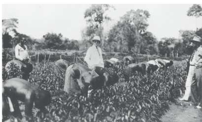
Le travail forcé